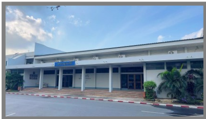
ภาพ หน้าหอประชุมรูปะเตมีย์ กองบิน ๖

หมายเหตุ : การจราจรในเขตกองทัพอากาศ ขอให้ปฏิบัติตามกฎจราจรโดยเคร่งครัด